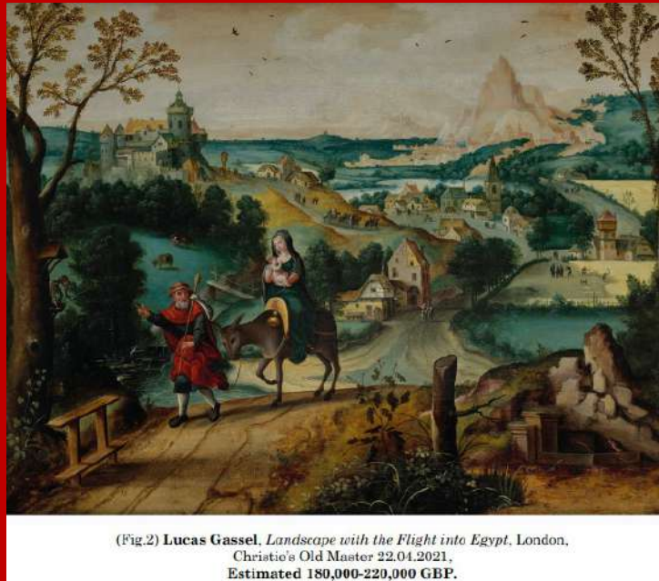
(Fig.2) Lucas Gassel, Landscape with the Flight into Egypt , London, Christie's Old Master 22.04.2021, Estimated 180,000-220,000 GBP.

La tabla data de los años cuarenta del siglo XVI y puede compararse con otras obras del